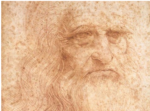
Bildquelle: Leonardo da Vinci, de.wikipedia.org/wiki/Leonardo_da_Vinci#/media/File:Leonardo_da_Vinci_-_presumed_self-portrait_-_WGA12798.jpg , Public Domain