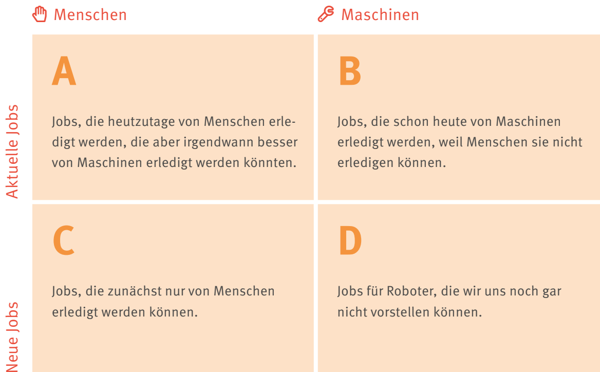
Abbildung basiert auf: